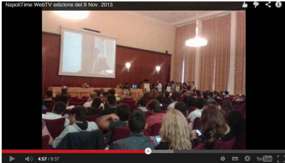
Video giornale Napoli Time Web Tv

http://www.napolitime.it/2013/11/videogiornale-napolitime-webtv-edizione-del-9-novembre-2013/