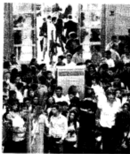
Orientasud La scorsa edizione del salone dell'orientamento